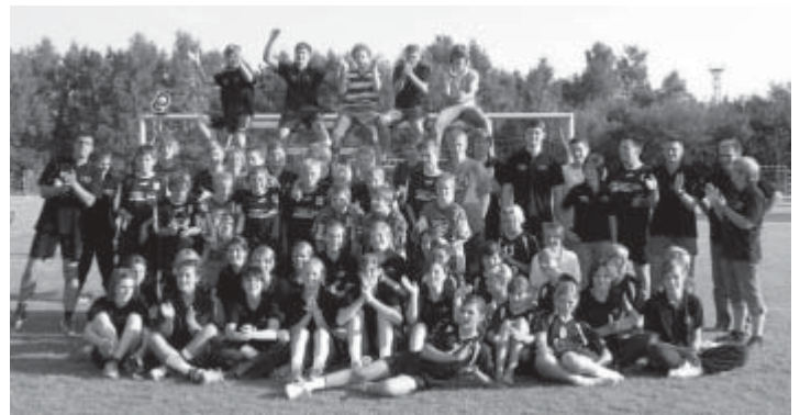
Die HSG Bü/Dro wurde zum zweiten mal in Folge der erfolgreichste Turnierteilnehmer beim Rasenhandball-Turnier in Hollenstedt