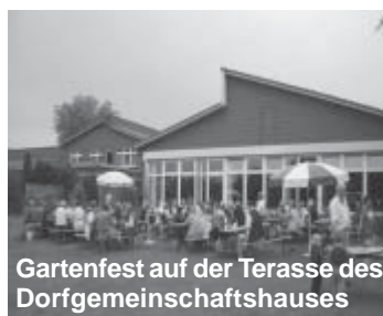
Gartenfest auf der Terasse des Dorfgemeinschaftshauses

Am Sonntag, den 20. Juli um 14:30 Uhr lädt der Bürgerverein zum Gartenfest am oder im Dorfgemeinschaftshaus ein. Bei Sonnenschein und sommerlichen Temperaturen gibt es draußen auf der Terasse den leckeren selbstgebackenen Kuchen der DRK-Damen. Wird es kühl und nass, steht der große Saal des Dorfgemeinschaftshauses zur Verfügung. Für die Musik sorgt in die-