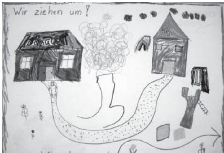
Ein Kindergartenumzug will gut geplant sein; in den Büchern steht, wie's gemacht wird

Am Dienstag, den 1. Juli soll das Notquartier in der Bützflether Grundschule vollständig geräumt sein und der erste Tag in der neuen Kita im Dorfgemeinschaftshaus kann beginnen. Um 9:00 Uhr öffnet sich die Tür für die Kinder der Vormittagsgrup-