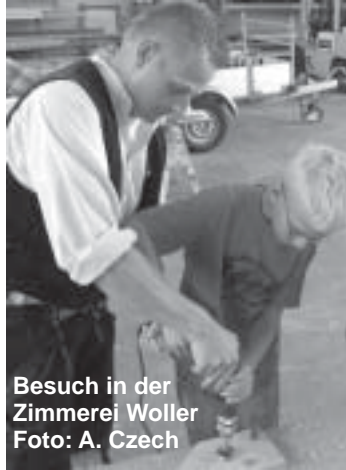
Besuch in der Zimmerei Woller