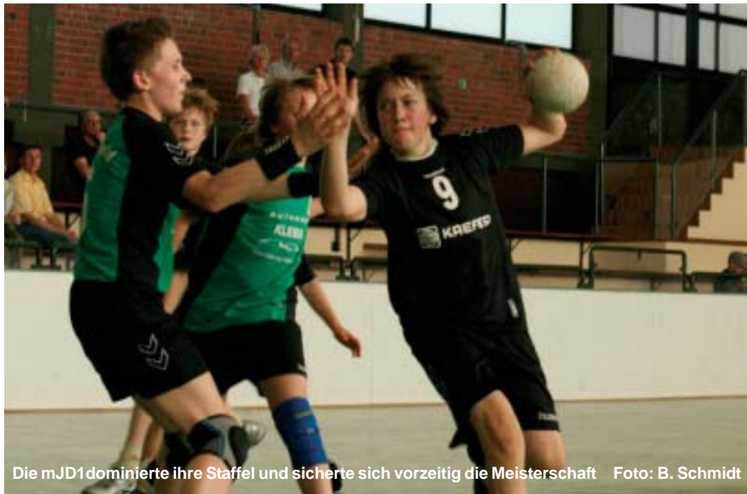
Die mJD1 dominierte ihre Staffel und sicherte sich vorzeitig die Meisterschaft

Das nächste Handball Blatt erscheint am 16.05.2009