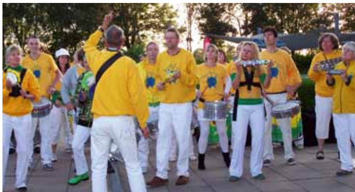
Wenn schon kein heißes Wetter, dann eben heiße Rhythmen

diesjährigen Besucherergebnis von nicht ganz 26.000 Besuchern: „Wir hatten einfach zu wenig zusammenhängende warme Sommertage“, bedauert Brandt und hofft nun auf eine bessere Saison im nächsten Jahr. Aber nicht nur mit der geringen Anzahl von Besuchern hatte das Freibad zu kämpfen. Auch die Organisation des Reinigungsdienstes bereitete Probleme. An manchen Tagen war es nur Dank des Einsatzes von einigen Unermüdlichen möglich, die Sauberkeit - das Aushängeschild unseres Freibades - zu gewährleisten. Leider sind auch die Bützflether Wohlfühlabende nicht so angenommen worden wie erhofft. Trotz unterschiedlicher Angebote von Fitness über Leseabend bis hin zum Auftritt der Samba-