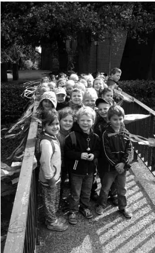
Das Foto zeigt den Gang der Kinder über die Brücke von der Kita zur Schule am 13.09.2011 anlässlich der ersten Brückenjahrstunde.

Um so erfreulicher ist es, dass das Projekt in