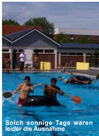
Solch sonnige Tage waren leider die Ausnahme

Diese Frage hat sich der Trägerverein in diesem Jahr oft gestellt. Aber mit Wettervorhersagen wie: morgens leichter Nieselregen, 15 Grad, mittags bedeckt, 18 bis 19 Grad, abends