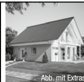
Abb. mit Extras

Grundstück in Elbnähe, voll erschlossen, 700 m 2 für KP 24.500 € , sofort bebaubar z. B. mit Haus Clou , 120 m 2 als Ausbauhaus, inkl. Bodenplatte und allen Materialien für den schlüsselfertigen Ausbau schon ab 136.423 €