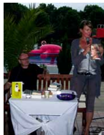
... und den Geist

reitstehen. Mehr dazu wird in einer der nächsten Ausgaben des Handballblattes berichtet. Aktuellen Meldungen sind auf der Internetseite www.buetzflether-freibad.de zu finden. Anregungen und Hinweise