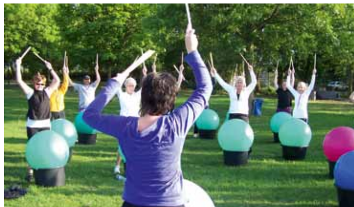
An den Wohlfühlabenden gab etwas für den Körper ...

Zur Zeit laufen die Planungen, denn in der nächsten Saison soll das neue Wasservergnügen be-