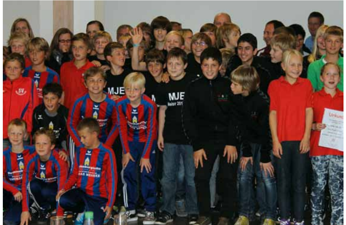
Sportlerehrung der Gemeinde Drochtersen. Mitten drin Vertreter unserer mJE1 und mJD1, die in der vergangenen Saison beide Kreismeister wurden.

Das nächste Handball Blatt erscheint am 15.10.2011