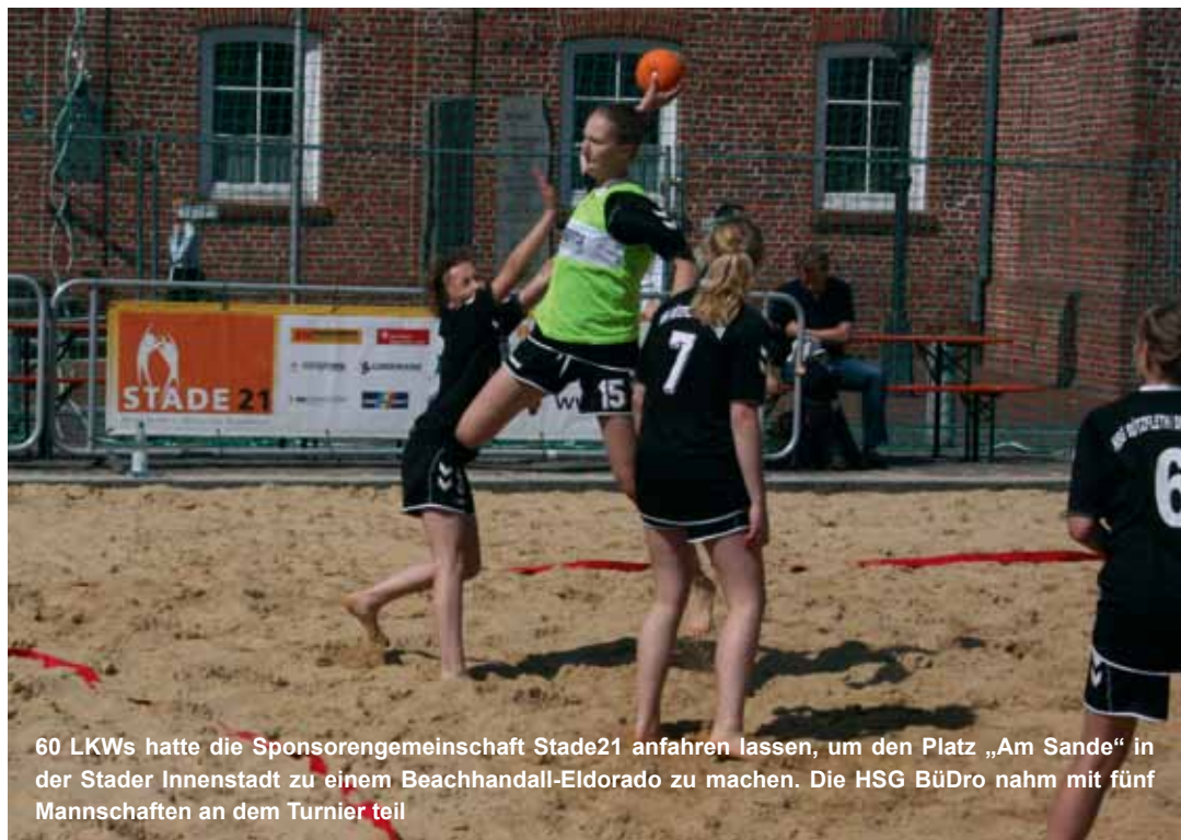
60 LKWs hatte die Sponsorengemeinschaft Stade21 anfahren lassen, um den Platz „Am Sande“ in der Stader Innenstadt zu einem Beachhandball-Eldorado zu machen. Die HSG BüDro nahm mit fünf Mannschaften an dem Turnier teil

Die Turniere finden statt im Sportzentrum Bützfleth