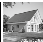
Abb. mit Extras

Grundstück in Elbnähe, voll erschlossen, 700 m 2 für KP 24.500 € , sofort bebaubar z. B. mit Haus Clou , 120 m 2 als Ausbauhaus, inkl. Bodenplatte und allen Materialien für den schlüsselfertigen Ausbau schon ab 136.423 €