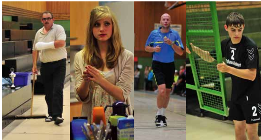
Die einen nahmen den Ball in die Hand, die anderen Besen, Kaffeekanne, Pfeife oder Tribüngitter

Landesliga geschnuppert hatte, landete verdient auf Platz 2. Dahinter platzierte sich unsere 2. Herren, die mit einigen A-Jugendlichen antrat. Die gezeigte Leistung macht Mut für die neue Saison, denn da will das Team oben mit angreifen. Buxtehude ist im weiblichen Jugendbereich eine Macht. Im B-Jugendturnier bot unsere Mannschaft erfolgreich Paroli. Beide Teams waren etwa gleich stark.