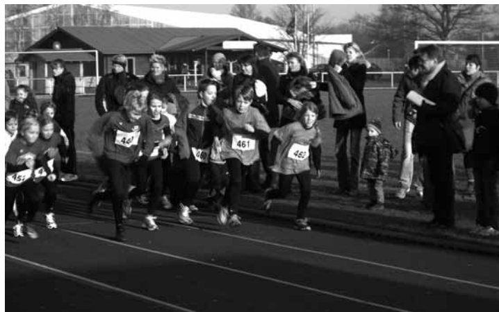
Start zum 1000-Meter-Lauf der Kinder

Zum 38. mal hatte der TVG Drochtersen zum Jahreswechsel seinen Sylvesterlauf ausgerichtet - also erst laufen und dann böllern. Insgesamt 454 Teilnehmer gingen auf die verschiedenen Strecken und 410 kamen auch ins Ziel. Neben dem Wandern und Nordic Walking über die 10 km Distanz wird für die Kinder auch ein 1000-Meter-Lauf angeboten. Das Herzstück der Veranstaltung ist aber der 10 km-Lauf, zu dem sich 329 Teilnehmer gemeldet hatten.