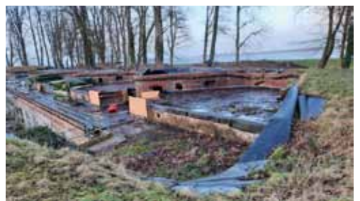
Nach dem Fällen einiger Bäume bietet sich ein grandioser Blick auf die Elbe.