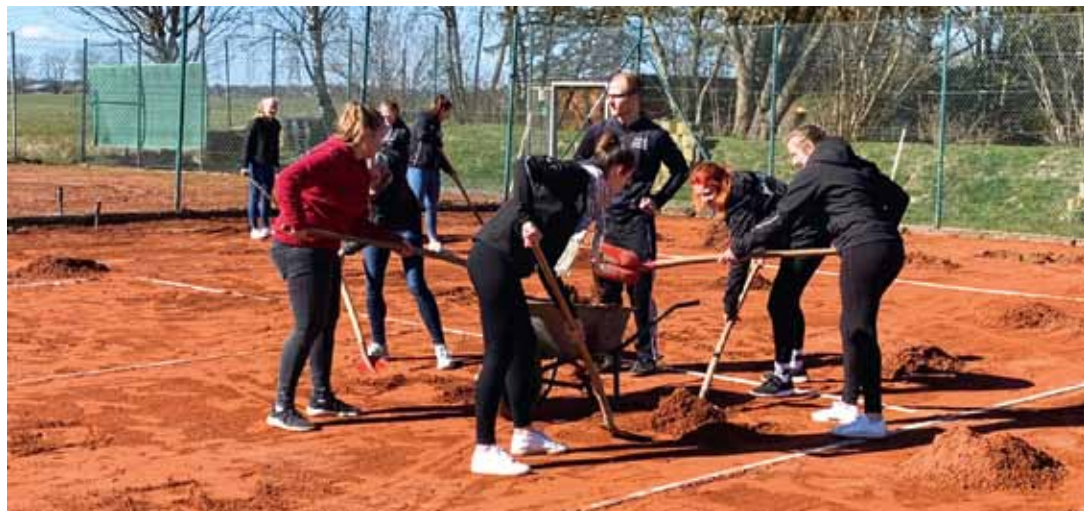
Frühjahrsputz gibt es nicht nur in der Wohnung sondern auch auf den Tennisplätzen hinter dem Freibad - Mitglieder der Tennisabteilung und HSG-Handballer legten Hand an (mehr auf Seite 8).