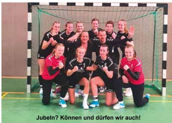
Jubeln? Können und dürfen wir auch!