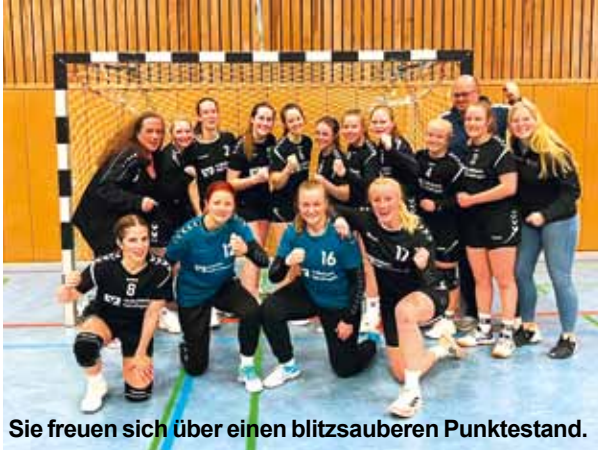
Sie freuen sich über einen blitzsauberen Punktstand.