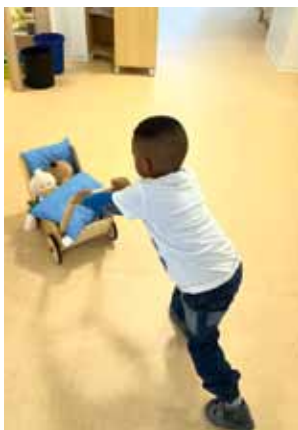
Wer sagt denn, dass nur Mädchen Kuschtierchen spazieren fahren mögen.

Die Kinder mögen es sehr, sich jeden Tag mit dem tollem Spielangebot zu beschäftigen. Dazu gehört Kochen in unserer Spielküche, Kneten, die Puppen spazieren fahren, mit den Marienkäfern durch den Flur flitzen, Bücher angucken oder im Tauschraum klettern. Bericht: Kirsten Krohne