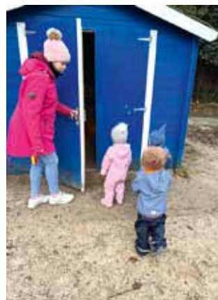
Draußen spielen geht immer - die richtige Kleidung muss halt her.