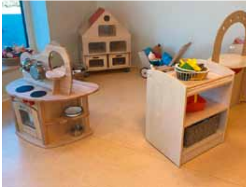
Angesichts der neuen Spielecke schlägt doch jedes Kinderherz höher. Zuerst das Essen machen oder lieber spazieren fahren?