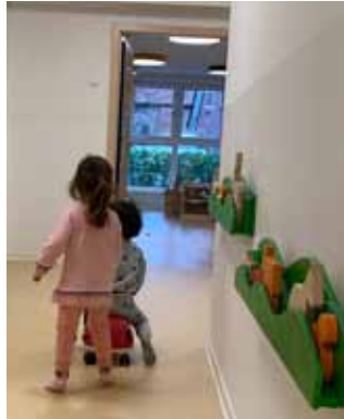
Bei schlechtem Wetter wird der Flur zur Rennbahn