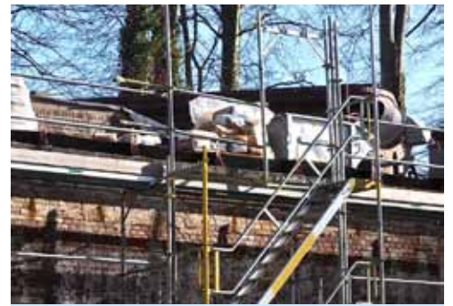
Die Dachflächen müssen umfassend saniert werden.