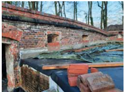
Maurerarbeiten werden den Vorschriften des Denkmalschutzes entsprechend durchgeführt.