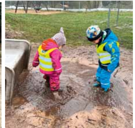
Nichts geht über Rumplatschen in der Matschpampe - ein Hoch auf das große Kita-Außengelände.