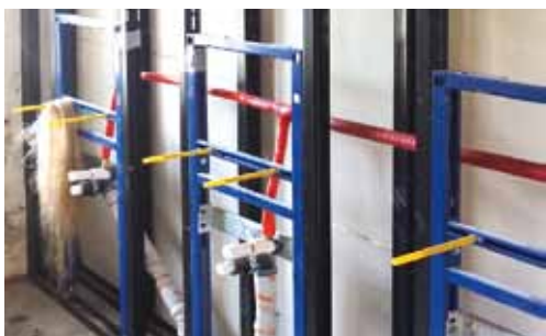
Installation für die Sanitärräume

Spaziergänge auf dem Deich bei Grauerort haben in den letzten Wochen ungewohnte Geräusche gehört - sägen, klopfen, hämmern. Aber keine Angst, die Festung wird nicht abgerissen, im Gegenteil.