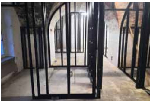
Vorbereitung für die Trockenbauer