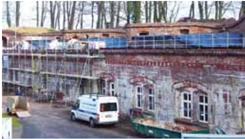
Umfassende Sanierungsarbeiten haben begonnen.