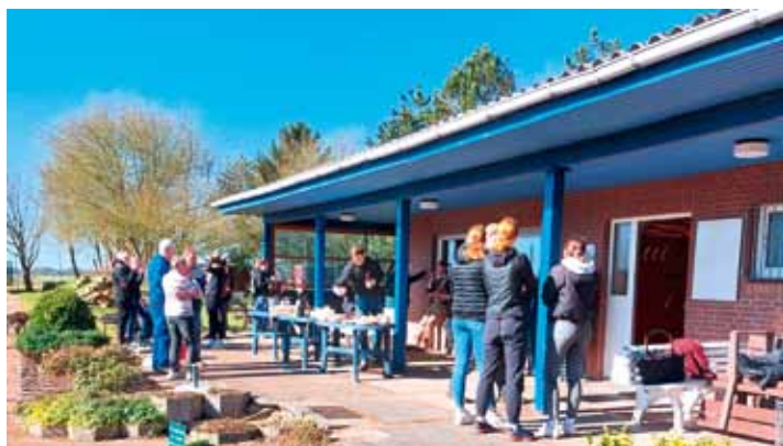
Und nach der getanen Arbeit kam das Vergnügen

Gemeinsam wurde der Frühjahrsputz auf der Tennisanlage angegangen. Nach den Stürmen im Frühjahr war einiges im Umfeld der Tennisplätze zu bereinigen. Zudem gilt es auch jedes Jahr im Frühjahr, die Tennisplätze vom alten Ziegelmehl zu befreien und wiederum neues Ziegelmehl auszubringen. Den Mitgliedern der Tennisabteilung fehlt es derzeit ein wenig an Nachwuchs und der Altersdurchschnitt der Aktiven ist