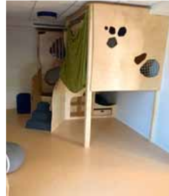
Donnerwetter - das lädt zum Klettern, Verstecken oder Träumen ein.