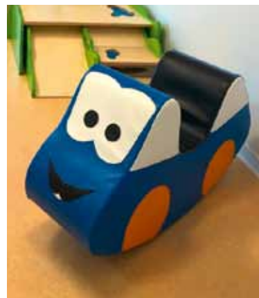
Das Schaukelauto ist sehr beliebt, aber manchmal braucht es eine Pause.