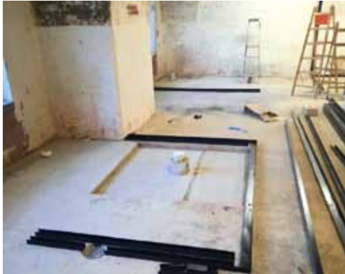
In den Kasematten sollen moderne Sanitäranlagen eingebaut werden.