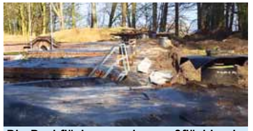
Die Dachflächen werden großflächig abgedichtet.