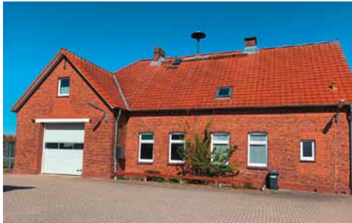
Das Feuerwehrgerätehaus in Bützflethermoor ist baulich wirklich nicht auf einem modernen Stand.

tehaus genutzte Gebäude wurde 1896 als Schule gebaut. 1968 wurde der Schulbetrieb am Bützflethermoor eingestellt. Die Lehrerwohnung wurde noch mehrere Jahre vermietet. Die Schulräume wurden nicht mehr genutzt. 1974 wur-