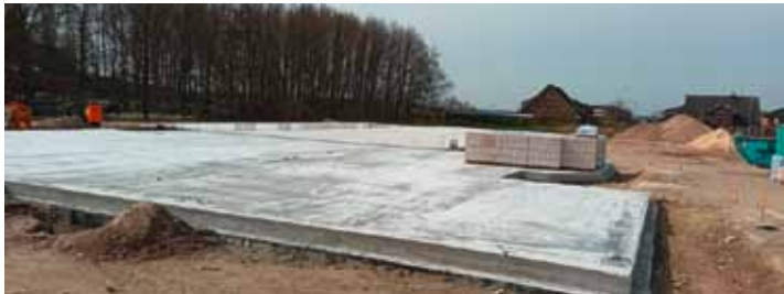
Auf der Baustelle für das neue Gerätehaus am Obstmarschenweg sind die Baufortschritte erkennbar.

Schon für Anfang des nächsten Jahres ist der Umzug geplant