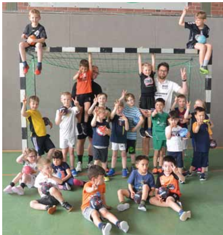
Bald ist Mini-Spielfest. Wir, die Bützflether Minis sind dabei - Du kommst doch auch?

Unter Corona haben Viele gelitten. Der Handball war lane stark eingeschränkt, über Monate hinweg fanden keine Spiele statt. Besonders hart erwischte es aber unsere Jüngsten, die Minis. Für sie gibt es keine Ligen, in denen Punktspiele stattfinden. Lediglich bei sogenannten Spielfesten können sich die Kleinen mit Mannschaften von anderen Vereinen messen. In den letzten beiden Jahren wurden wegen Corona alle Mini-Spielfeste abgesagt. Jetzt warten alle ganz gespannt darauf, sich auch einmal vor Publikum zu zeigen. Da können Eltern, Geschwister, vielleicht auch Oma und Opa oder die Freunde sehen, wie gut man schon Handball spielen kann. Am Sonntag, den 22. Mai wird in der Bützflether Sporthalle vormittags ab 09:30 Uhr das Leben toben. Ein Dutzend Mini-Mannschaften, vermutlich 6 Anfänger und 6 Fortgeschrittene werden zeigen, was sie können. Gespielt wird auf kleinen Feldern mit kleinen Toren und