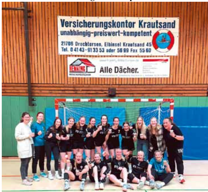
Schon drei Spieltage vor dem Saisonende ist der 2. Damenmannschaft die Meisterschaft nicht mehr zu nehmen.