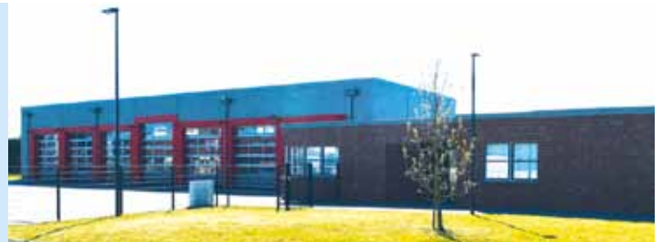
Und so soll das Gerätehaus einmal aussehen, wenn es fertig gestellt ist.

Von der Nicolaus-Dreyer-Straße aus gesehen, wird am Anfang der Sozial- und Verwaltungstrakt entstehen. In diesem Bereich werden u.a. Büroräume, Schulungsräume, Sanitäre Einrichtungen, Aufenthaltsräume und Technikräume entstehen. Neben diesem Trakt