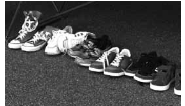
Viel gelaufen und der Schuh drückt? - Kein Problem