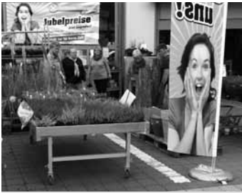
Einzelhändler hatten Sonderangebote parat.