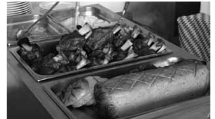
Und natürlich gab es auch das Deftige gegen den großen Hunger.