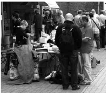
Auch am Straßenrand lockte manches Schnäppchen.