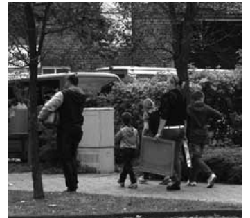
Mancher trug am Ende mehr als ein leichtes Päckchen.