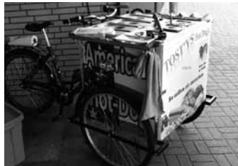
Zwischendurch ein Snack gegen den kleinen Hunger