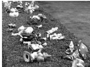
Was es nirgends gibt, findet man auf dem Flohmarkt.