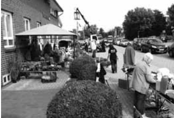
Sonderverkaufsflächen an mehreren Stellen