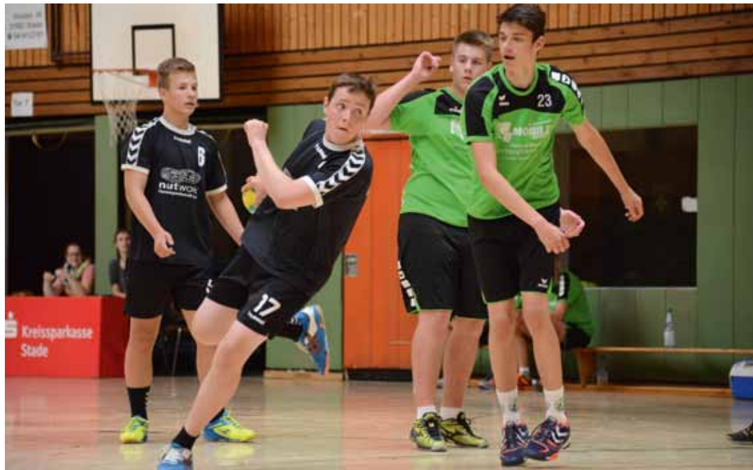
Den Reigen der diesjährigen HSG BüDro-Turniere eröffnete am vergangenen Wochenende die männliche B-Jugend.