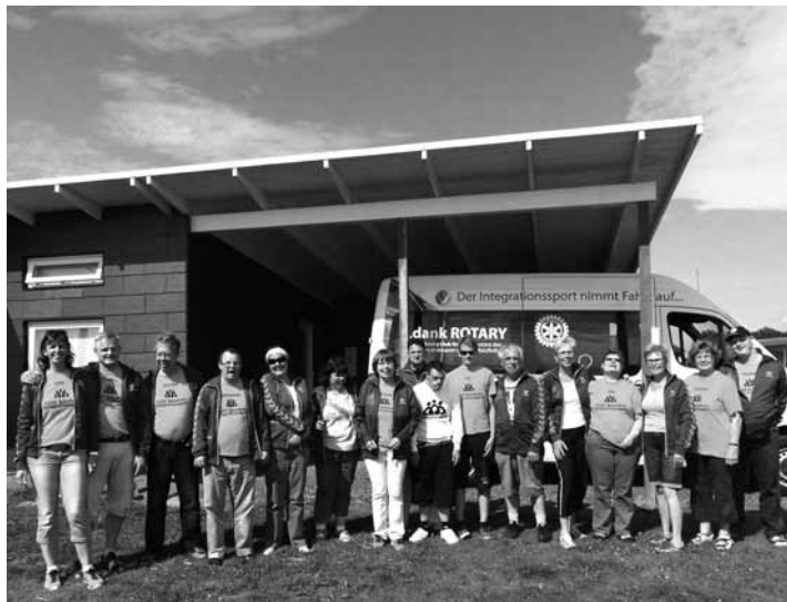
Die Integrationsportgruppe mit ihren Betreuern in Dänemark. Es war eine abwechslungsreiche Woche.

Für jeden Tag war ein Highlight geplant, das von „ALLEN“ gerne angenommen wurde. Es wurde gegrillt, getanzt und viel gelacht. An einem Tag ha-