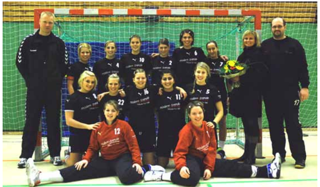
Im Jahr 2007 wurde das Handball Blatt farbig. Die 1. Damenmannschaft (Foto oben) spielte damals in der Kreisoberliga und schaffte den Aufstieg in die Landesliga. Erkennen Sie die Spielerinnen? In dieser Saison ist unser Team in der Oberliga angekommen. Wir wünschen viel Erfolg!

Das nächste Handball Blatt erscheint am 18.09.2015