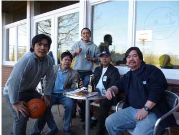
Seemannsmission „Oase“ - da ist der Name Programm

In einem kleinem „Shop“ können die Seefahrer Dinge des täglichen Bedarfs oder für den Verzehr während ihres Aufent-