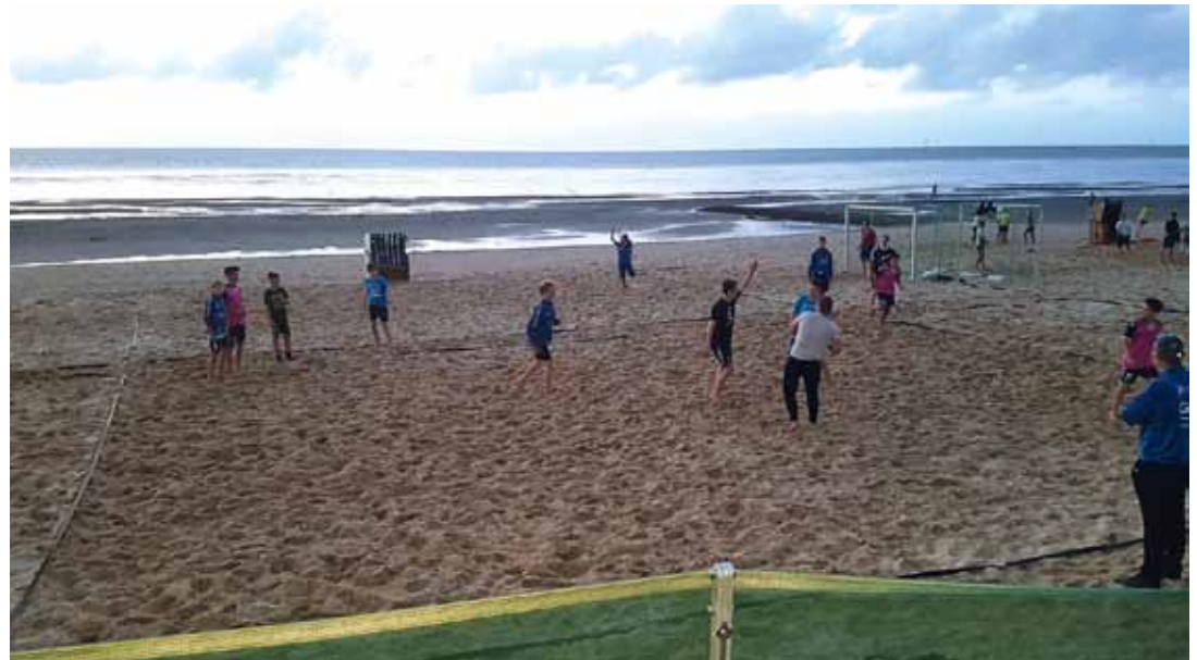
Was kann es Schöneres geben, als seinen Lieblingssport im Sommer am Strand auszuüben - die männliche Jugend C beim Beachhandball-Turnier in Cuxhaven