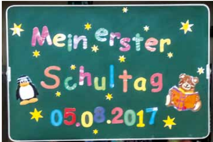
Zwei neue 1. Klassen und eine Schulkindergartengruppe gibt es in diesem Jahr in Bützfleth. Weitere Fotos der Einschulung in unserer Online-Ausgabe. Fotos der ABC-Schützen in der nächsten BHB-Ausgabe

Nachdem das -aus ihrer Sicht lästige Pflichtprogramm geschafft war, marschierten sie mit ihren Lehrerinnen Frau Böhnke, Frau Schöppner-Kö-