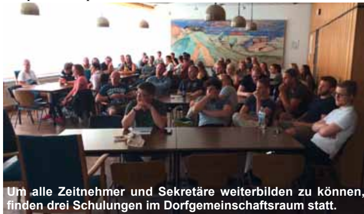
Um alle Zeitnehmer und Sekretäre weiterbilden zu können, finden drei Schulungen im Dorfgemeinschaftsraum statt.