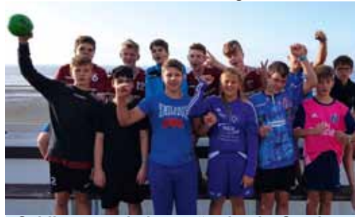
„Schlimmer geht immer“ - aber im Sand von Cuxhaven ging es schon recht gut

an die Eltern, die den Weg nach Cuxhaven gewagt haben. Am Abend dann noch eine Abkühlung im Ahoibad. Das Trainertrio machte sich erneut für eine lange Nacht startklar. Doch zu unserer Verwunderung war