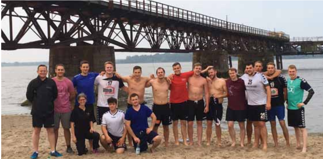
Beim Saisonvorbereitungstraining am Strand bei Grauerort ackerten Spieler der 1. Herrenmannschaft zusammen mit ihren Kollegen aus den anderen Herrenteams, ganz nach dem Motto: „Geteiltes Leid ist halbes Leid“

Handball in Bützfleth und in der HSG BüDro jahrelang geprägt und begleitet. Viele der jetzigen Spieler haben sicher zu dem ein oder anderen MiB-