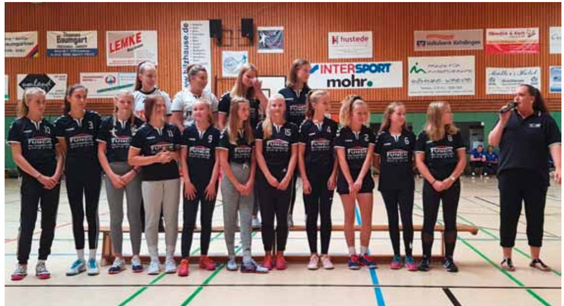
Gratulation für unsere weibliche Jugend C1, die den Sprung in die Vorrunde der Oberliga-Qualifikation schaffte