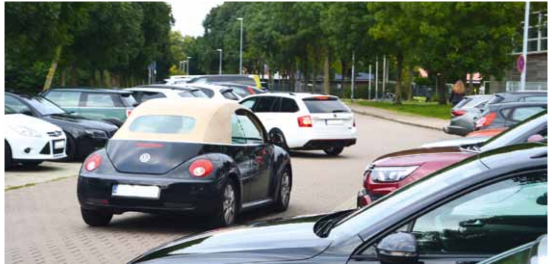
Wie in alten Zeiten - es ist Heimspieltag und Andrang auf dem Parkplatz vor der Sporthalle