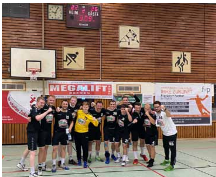
Endstand 22 : 26, ein guter Grund zur Freude