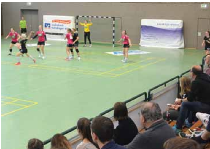
Nach langer Zeit endlich wieder ein Punktspiel und das in eigener Halle mit den Fans auf der Tribüne.

Beim Saisonauftakt gegen Findorff am vergangenen Samstag betraten große Teile der Mannschaft unbekanntes Terrain. Nach einer solchen langen Pause kann keiner die Leistungsstärke der Gegner wie auch den eigenen Leistungsstand gut einschätzen. Das Ziel mit diesem jungen Kader kann nur der Klassenerhalt sein und gleichzeitig soll der Spagat gelingen, den Spielerinnen die Möglichkeit