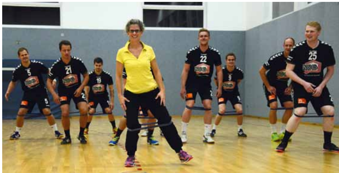
Gute Saisonvorbereitung + guter Saisonstart = viel Spaß am Handball bei der 1. Herrenmannschaft

Das nächste Handball Blatt erscheint am 07.11.2015