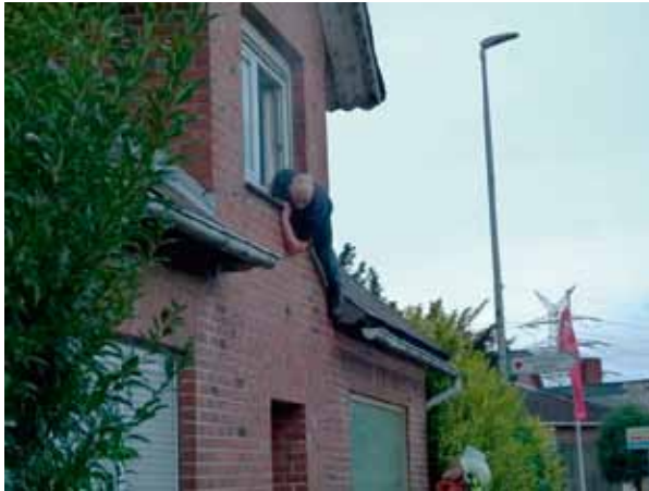
Ein Bewohner versucht sich vor dem Rauch zu retten

Martinshorn geht's weiter zur Einsatzstelle.