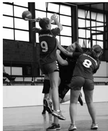
Ein umkämpftes Spiel wJA2 : Bremervörde