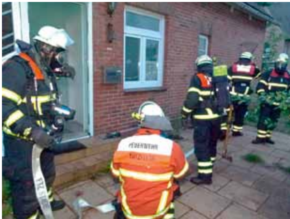
Trupps unter schwerem Atemschutz warten auf ihre Einsatzbefehle

„Feuer im Obstmarschenweg 332, brennt Küche, starke Verqualmung, vermutlich noch Personen im Gebäude“ Egal ob Auto, Fahrrad oder zu Fuß, möglichst schnell eilen alle zum Gerätehaus. Dort angekommen, ab in die Einsatzklamotten und rein in die Feuerwehrautos, mit Blaulicht und