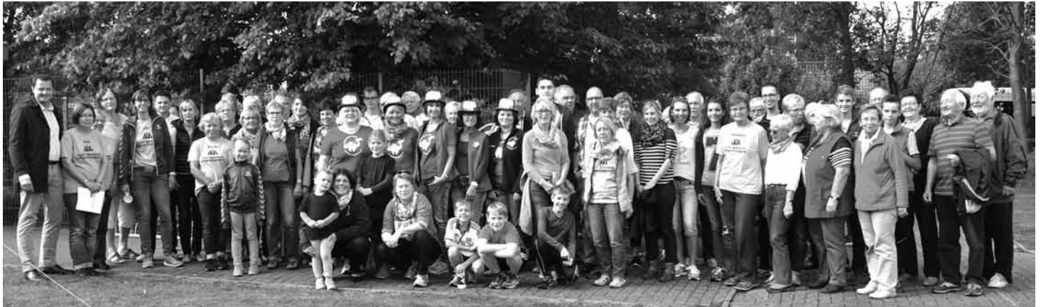
Die freiwilligen Helfer beim 45. Integrationsportfest. Viele weitere Fotos finden Sie auf der Internetseite des TuSV unter der Adresse www.tusv-buetzfleth.de

Am 18. September fand das 45. Integrationsfest statt. 4 Stunden lang tobte rund um die Sporthalle das Leben. Viele Gäste waren gekommen, um einen unbeschwerten Nachmittag zu genießen. Ich möchte meinen allerherzlichsten Dank an alle