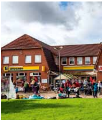
Bei edeka-Wiesner gab es Indoor- und Outdoorangebote

Gutes Wetter, fröhliche Menschen und zufriedene Gewer-