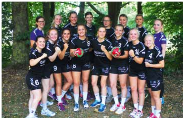
Die 1. Damenmannschaft startete mit einer Niederlage in die neue Saison