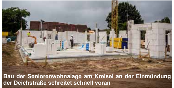
Bau der Seniorenwohnanlage am Kreisel an der Einmündung der Deichstraße schreitet schnell voran

Astrid Eggert und Katharina Goedecke erklärten, dass