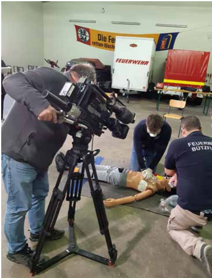
Einsatzkräfte der Feuerwehr Bützfleth und Bützflethermoor demonstrieren den schnellen Einsatz bei Herzstillstand und Reanimation

Das war für die Männer und Frauen von der Bützflether Feuerwehr und der Löschgruppe aus Bützflethermoor kein alltäglicher Einsatz. Ein Team des NDR 3 war am vergangenen Samstag nachmittag bei ihnen zu Gast.