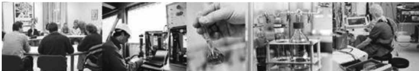
Die Firma Aneco stellte die Ergebnisse der Immissionsmessungen in Bützfleth vor. Auf den Extraseiten unserer Onlineausgabe können Sie die vollständige Präsentation einsehen

- alle Grenz- und Beurteilungswerte werden eingehalten - das Belastungsniveau ist im bundesweiten Vergleich