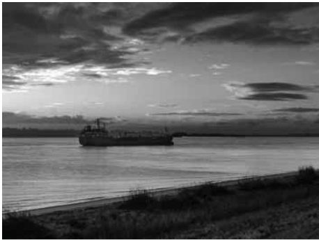
Die Elbe auf Augenhöhe - ein vertrauter Anblick

Ein wirkliches Kino gibt es in Bützfleth nicht, aber am Mittwoch, den 13. November nachmittags um 15:00 Uhr laden die LandFrauen Kehdinger Moor zu einem Filmnachmittags ins Dorfgemeinschafts-