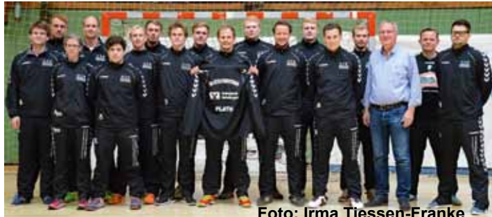
Neue Trainingsanzüge, gesponsert von der Volksbank Kehdingen und gleich auch zwei Siege eingefahren