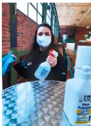
Ohne sorgfältige Desinfektion geht nichts