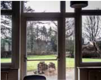
Neue Fenster eingebaut und auch auf der Außenterrasse wurde Hand angelegt

Es hat ja doch eine geraume Zeit gedauert bis der Findungsprozess im Ortsrat zu einem Ergebnis geführt hat: Jetzt können die Bützfletherinnen und Bützflether - wenn denn Corona vorbei ist - die neue Bestuhlung bestaunen und natürlich auch benutzen. 24 praktische roll- und klappbare Konferenz-