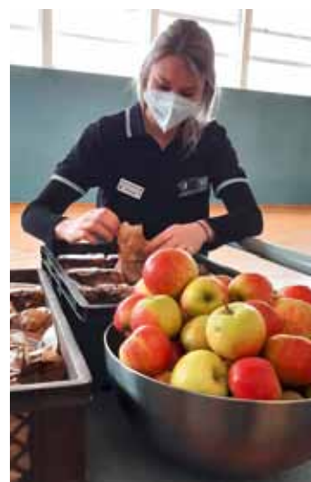
Zum Schluss ein gesunder Snack für die Spender