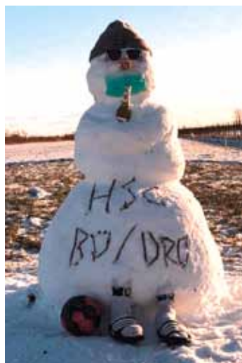
Lynn + Tessa; wJB