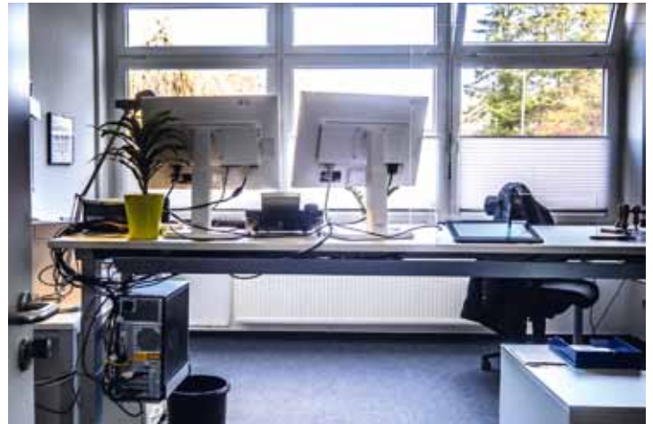
Auch das Arbeitszimmer der Verwaltungsmitarbeiterin erhielt eine Verjüngungskur.

Im großen Saal wird auch der Fußboden noch erneuert, neue Jalousien kommen hinzu und