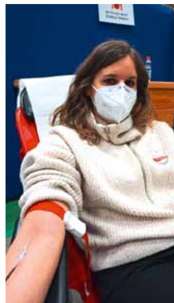
Ein kleiner Pieks und schnell ist alles vorbei