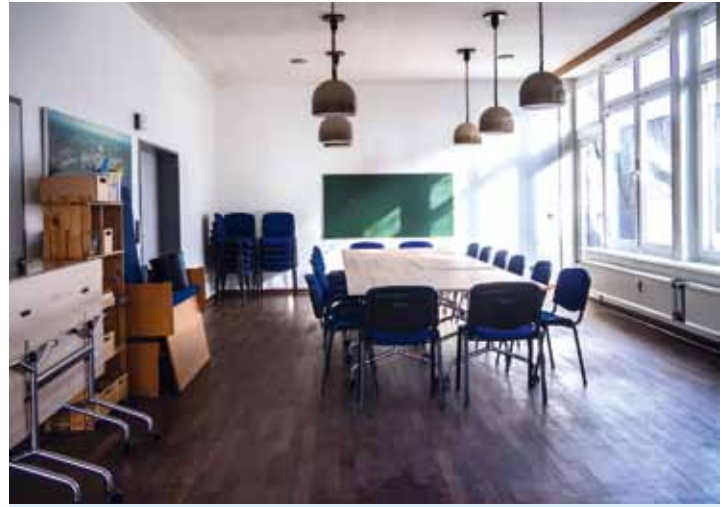
Stühle mit und ohne Lehne wurden beschafft, die Lampen im großen Sitzungssaal werden noch ausgetauscht.