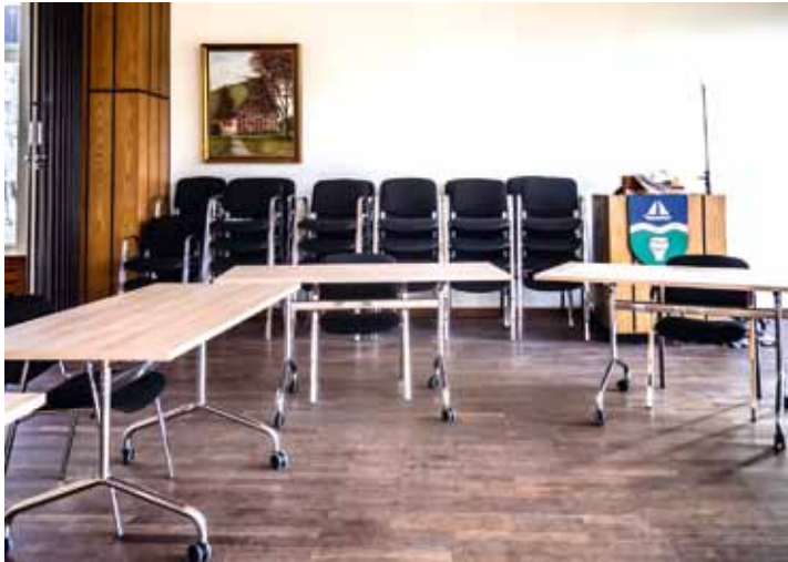
Neue Stühle und Tische, die beim Umbau nicht mehr geschleppt sondern gerollt werden können

Funktionale Möblierung, neue Fenster und die Sanierung der Fußböden waren längst nötig geworden