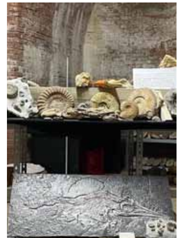
Sehr alte Ausstellungsstücke in der alten Festung

Das unkonventionelle, aber wasserundurchlässige Deckendesign hat bald ein Ende