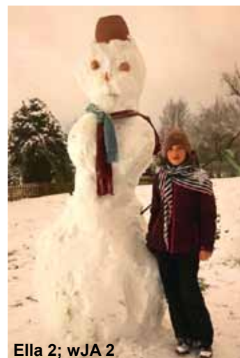
Ella 2; wJA 2