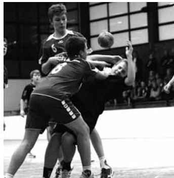
ImJC: Habenhausen