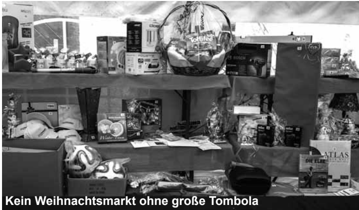
Kein Weihnachtsmarkt ohne große Tombola

... kamen am vergangenen Wochenende zum Bützflether Weihnachtsmarkt nach Grauerort. In den Kasematten der weihnachtlich geschmückten Festung und in den Ausstellerezelten hatten in diesem Jahr weit über einhundert Hobbykünstler