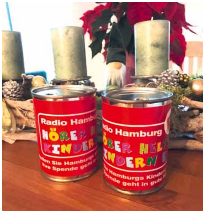
Beim Heimspieltag wurde aus HHK „Hörer helfen Kindern“ „Handballer helfen Kindern“

Erst wollten wir, wie die vielen anderen Leute auch, 10, 20 oder vielleicht auch 30 € als Familie spenden. Als Physiotherapeuten wissen wir aber, wie teuer zum Beispiel so ein Pflegerollstuhl für ein kleines Kind sein kann. Schnell kamen wir auf die Idee, Freunde und Familie zu fragen, ob sich jemand beteiligen möchte, denn hier gilt nun mal das Motto: Viel hilft viel. Meine Frau hörte dann zufällig in dem Aufruf im Radio, dass