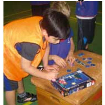
Etwas Köpfcchen zu haben, kann nie schaden