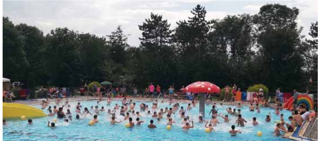
Das ist ein Foto aus vergangenen Jahren. Aber das Bützflether Freibad hat wieder geöffnet, allerdings mit begrenzter Besucherzahl. Deshalb ist über das Internet eine Anmeldung für über 14-jährige nötig.