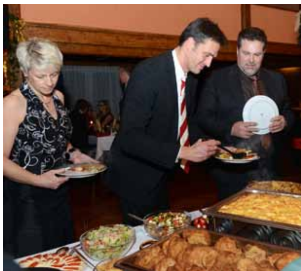
Um eine lange Ballnacht zu bewältigen, braucht es eine gute Grundlage. Am reichhaltigen Buffet hatte man die Qual der Wahl