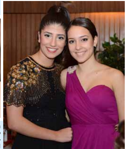
Handballerinnen der HSG BüDro oder doch Germanys next Topmodel