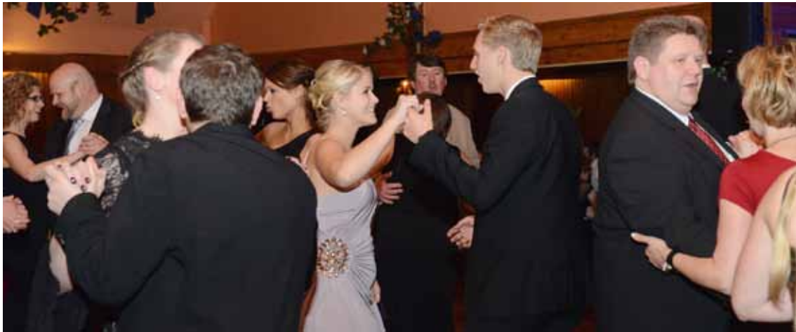
Natürlich wird bei einem Ball auch getanzt und wie man sieht sind Handballer durchaus keine bockbeinigen Tanzmuffel.