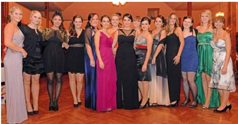
Ein etwas andere Mannschaftsfoto - die Spielerinnen der 2. und 3. Damenmannschaft setzten Glanzlichter.