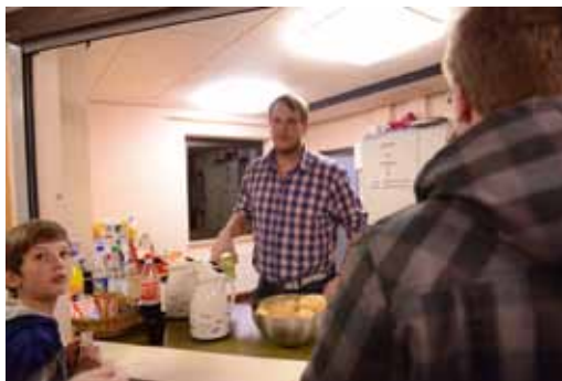
Mehr Platz, um die Gäste im Sportzentrum mit Getränken oder kleinen Snacks zu versorgen

Man war sich beim TuSV schon lange einig, dass Abhilfe geschaffen werden musste - ein Umbau wurde geplant. Die Stadt Stade gab ihr o.k. und die Tischlerei Mike Müller machte sich ans Werk. Die neue Kaffee-Kuchen-Getränke-Ausgabe ist jetzt großzügig erweitert. Wir können die Gäste bequemer versorgen. Und einen weiteren, mehr als erfreulichen Aspekt gibt es: die