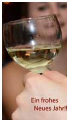
Ein frohes Neues Jahr!!