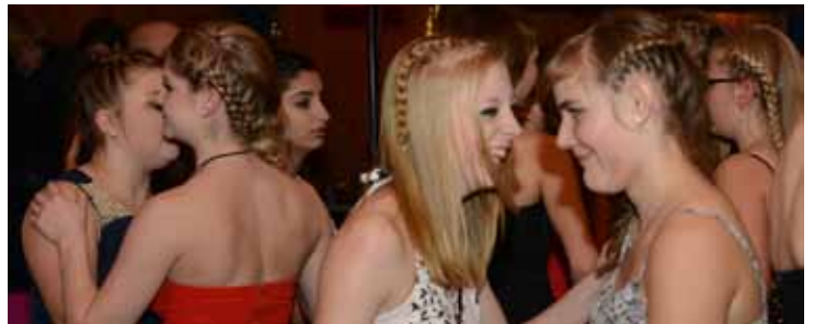
Flechtwerk in unterschiedlichsten Variationen