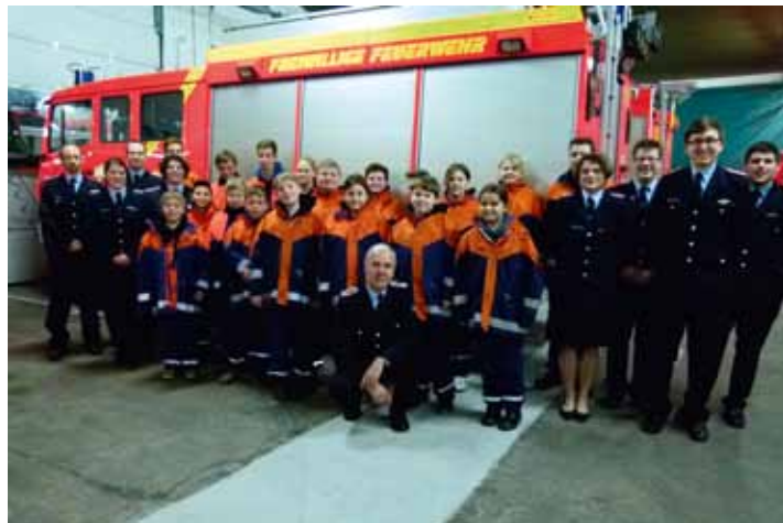
Nachwuchssorgen? Bei der Bützflether Feuerwehr dank guter Kinder- und Jugendarbeit kein Thema

Ein Dank der Jugendfeuerwehr ging an den Bürgerverein und die Sparkasse Stade-Altes Land für die großzügige finan-