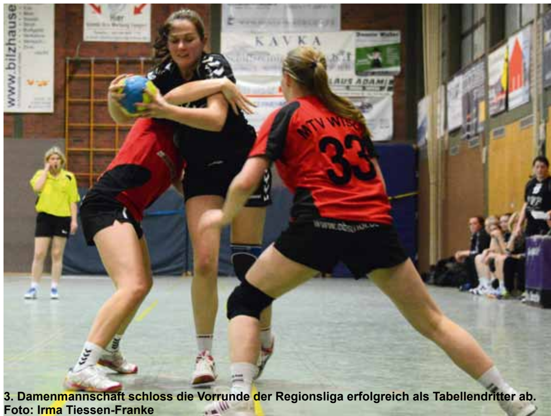
3. Damenmannschaft schloss die Vorrunde der Regionsliga erfolgreich als Tabellendritter ab.

18:45 Männer Regionsliga 3. Herren : Dollerner SC