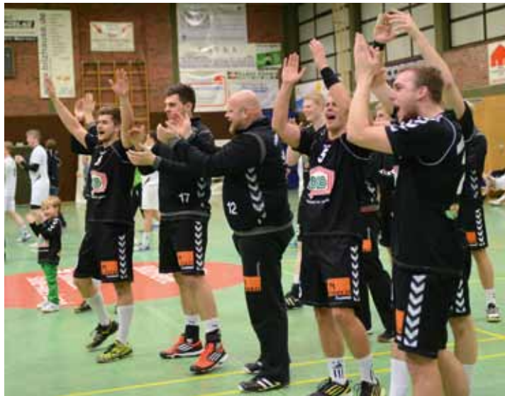
Das Spiel gegen SVGO wurde mit einem Tor gewonnen, auch dank der Unterstützung der Fans - das Team bedankt sich

dem Pausenpfeiff erhielten die Gäste noch einen 7-Meter zugesprochen. Es war ihr Siebter in der 1. Halbzeit.