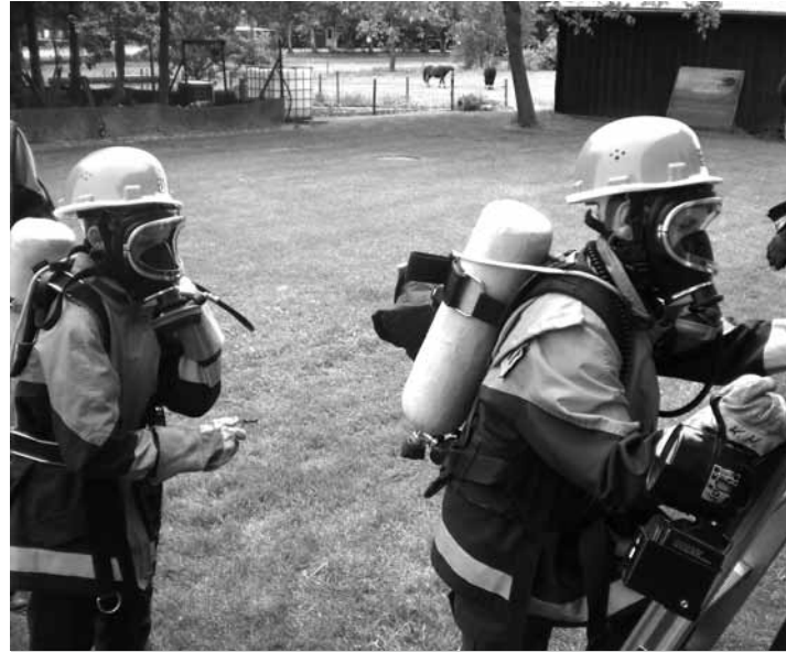
Auch in der Jugendfeuerwehr wird schon für den zukünftigen Ernstfall trainiert. Bisher wechselten 72 gut ausgebildete Jugendliche in die aktive Feuerwehr.

die endlos langen Wartezeiten beim allseits beliebten Pfannkuchen essen in den Griff zu bekommen, wurde nach reiflicher Planung eine zweite, große Pfanne angeschafft.