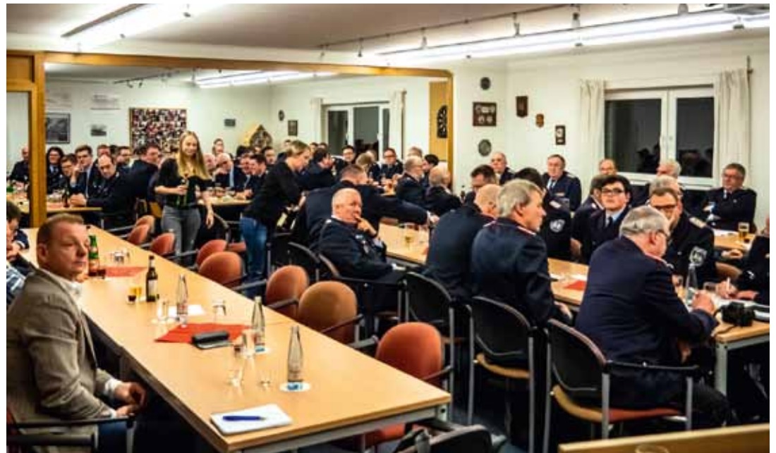
Im Gegensatz zu manch anderem Verein ist die Jahreshauptversammlung der Freiwilligen Feuerwehr immer sehr gut besucht.

17:00 Landesliga Männer 1. Herren : SG Achim/Baden 2