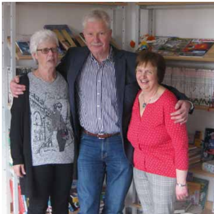
„Wir lassen die beiden nur sehr ungern gehen!“

Neben den vielen bekannten Aufgaben als Lehrerin in der Grundschule hat sie unsere Schülerbücherei mit großem Idealismus aufgebaut und diese