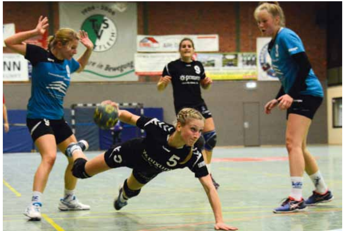
„Übergetreten“ - das kann man im Handball auch mit den Fingern

20:30 Pokal Frauen 2. Damen : VfL Fredenbeck 2