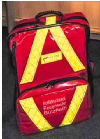
Auch in Bützfelth gibt es jetzt eine mobile Notfallgruppe, die mit Defibrillatoren ausgerüstet ist

Im Jahre 2008 wurde der erste Defibrillator (AED = Automatischer Externer Defibrillator) von der Hansestadt für die Wehr in Bützfleth beschafft, allerdings zunächst nur zum Zwecke der Eigensicherung der Feuerwehrleute. Ein weiteres Gerät kam über eine Spende im Jahr 2008 für die Löschgruppe im Moor dazu. Das führte dann letztendlich zu der Überlegung,