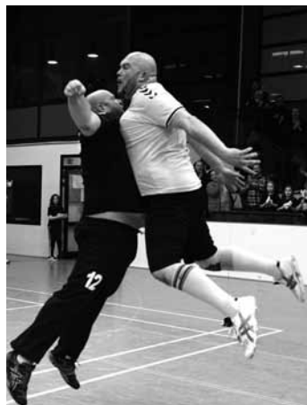
Sie haben es krachen lassen - die 1. Herren gewinnt gegen Cloppenburg