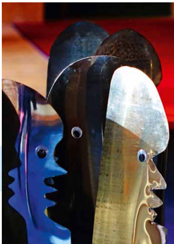
Erstaunte Blicke - die gab es auch bei manchem Besucher.

moderner Kunst abseits der Metropole zu organisieren war sicherlich ein Wagnis. Aber die positive Resonanz der Künstler, die ihre Werke nicht nur ausstellten sondern auch zum Verkauf angeboten hatten (mit viel Erfolg) und das große Interesse der Besucher gaben den Initiatoren recht. Vielleicht bleibt die Idee, solch eine Ausstellung nicht eine einmalige Veranstaltung sein zu lassen, nicht nur eine Idee.