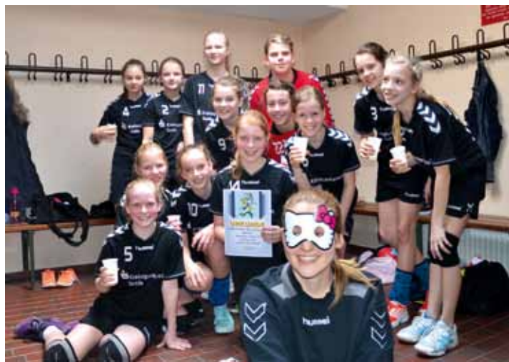
Die wJD1 hat in der Kreisliga die Meisterschaft errungen. Nach der Osterpause könnte die D2 oder die D3 in der Kreisklasse ebenfalls den Meistertitel einfahren.

war dann aber klar, dass wir die Rückrunde nur noch mit drei Mannschaften spielen würden. Aufgrund des Personalman-