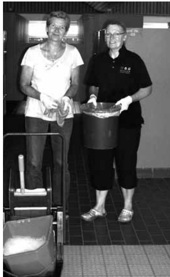
Vor dem Badevergnügen steht der Arbeitseinsatz

Leider wird wohl die Renovierung der Sonnenterrasse nicht umgesetzt werden können, weil