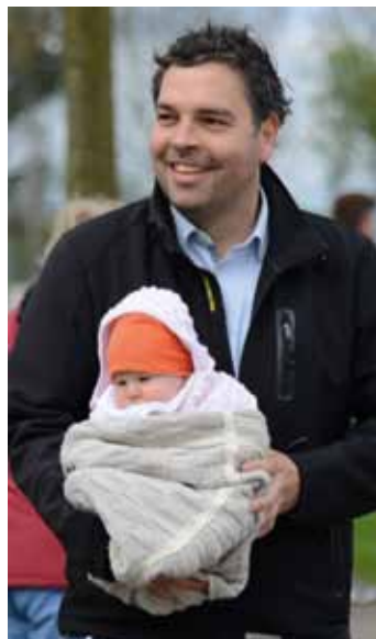
Schon mal schauen, wie es beim Fit&Fun Run so zu geht