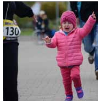
Ich will auch mit laufen