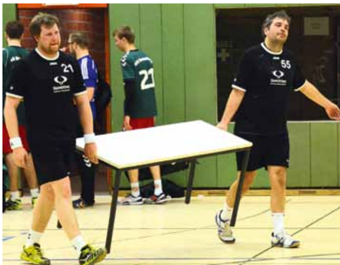
Manchmal geht es auch anders herum: erstmal das Vergnügen (Sieg gegen Zeven) und dann die Arbeit mit dem Aufräumen

In der ersten Halbzeit lernten wir dann zwei junge Spieler von Zeven etwas besser kennen, denn die beiden machten ein paar richtig schöne Tore gegen uns. Wir bekamen irgendwie, trotz intensiver Deckung, keinen Zugriff auf das Angriffsspiel der Zeven, die neben gut ausgespielten Angriffen auch