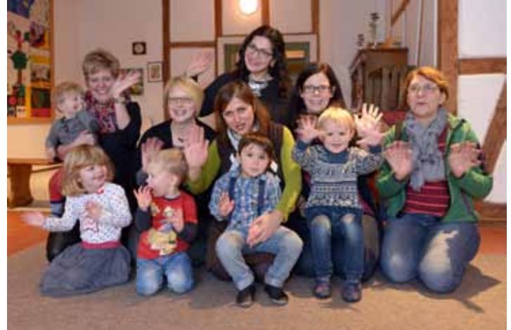
Sie würden sich über ein paar mehr Spielkameraden freuen

Eltern-Kind-Gruppe der FABI feiert Jubiläum