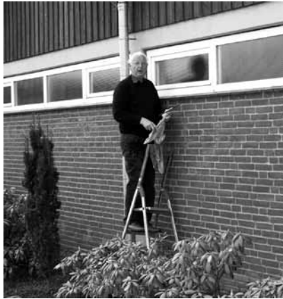
Über viele Besucher freuen sich die Verantwortlichen des Freibad Trägervereins, viele freiwillige Helfer braucht man aber genauso dringend.

zu verdanken gewesen, dass ein sauberes Freibad präsentiert werden konnte. Glück hatte der Trägerverein, dass in der vergangenen Saison wenig Schäden zu verzeichnen waren. Sicher ein Beleg da-