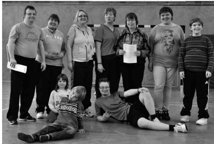
Das sind die Neuen beim Integrationssport des TuSV und sie fühlen sich dort richtig wohl