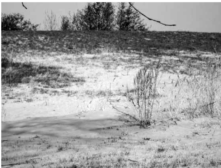
Zur Zeit gibt es am Abbenflether Strand mehr Sand als eigentlich gut wäre

Vor einigen Jahren hatte man sich oft etwas mehr Sand am Abbenflether Elbufer ge-