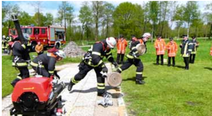
Die Löschgruppe Bützflethermoor hatte viel Zeit investiert und einen hervorragend präparierten Wettkampf ausgerichtet

War es am Vormittag noch recht grau am Himmel, so kam pünktlich mit Beginn der Wettkämpfe die Sonne zum Vorschein. Um 12:30 Uhr eröffnete Gastgeber Bützflethermoor als erste Gruppe die Wettkämpfe. Bei diesem Leistungswettbewerb stellen die angetretenen Feuerwehrgruppen ihr Können unter Beweis. Als Ausgangslage wurde eine Brandbekämpfung, mit Wasserentnahme aus einem „offenen“ Gewässer angenommen. Das diese