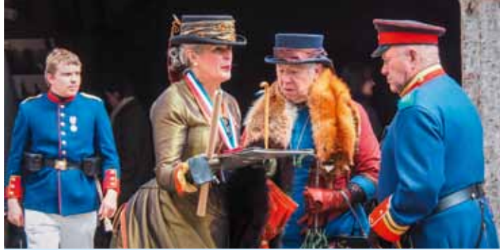
Zu den Festungstagen gehört die standesgemäße Garderobe

Ganz im Zeichen des 19. Jahrhunderts gab es einen historischen Handwerkermarkt und verschiedene zeitgenössische Ausstellungen zu sehen, die Soldaten campierten in einem authentischen Biwak und eine historische Feuerwehr zeigte ihr Können.