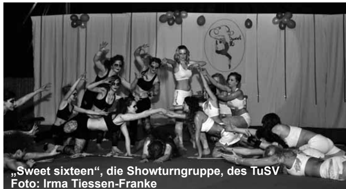
„Sweet sixteen“, die Showturngruppe, des TuSV

richtig laut in der Halle - „Samba Werk“ aus Stade trommelte, was das Zeug hergab. Und die Halle tanzte Samba. Anschlies-