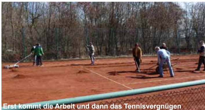
Erst kommt die Arbeit und dann das Tennisvergnügen

In diesem Jahr mussten wir unseren jährlichen Arbeitseinsatz für die Herrichtung der Tennisplätze aufgrund der „Großwetterlage“ zwei Mal verschieben. Am Wochenanfang strahlte die Sonne und am festgelegten Einsatztermin bedeckte eine 20 cm dicke Schneeschicht unsere Plätze. Auch der sich anschließende Frost machte einen Arbeitseinsatz unmöglich, da die Beregnungsanlage nicht in Betrieb genommen werden konnte. Mittlerweile schrieben wir aber schon den 4. April; Platzeröffnung war für den 20. April geplant - ein kaum einzuhaltender Termin. Andererseits waren die ersten Punktspieltermine auch mit dem 4. Mai fest vom Verband vorgegeben.