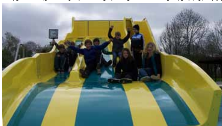
Zuerst beim Grundputz ordentlich mit angepackt und dann die neue Rutsche in Augenschein genommen: Die Nachwuchskräfte des Trägervereins freuen sich auf das Anrutschen.