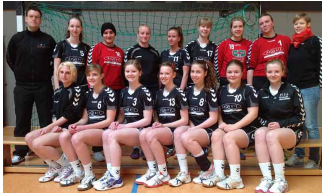
Unsere weibliche Jugend B sehen wir in der nächsten Saison in der Landesliga - Glückwunsch!

Das nächste Handball Blatt erscheint am 25.05.2013