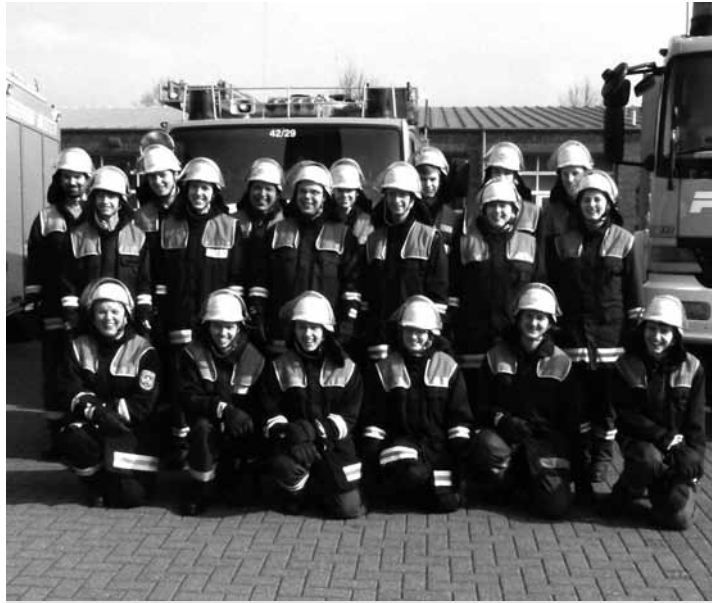
Sie haben allen Grund zur Freude: 19 Feuerwehranwärter der Stader Feuerwehren bestanden die Prüfungen der zweijährigen Truppmann-Ausbildung

Die Truppmann-Ausbildung erstreckt sich über zwei Jahre und ist in zwei Abschnitten eingeteilt. Der erste Teil geht über gut sechs Wochen. Es ist eine Art Grundlehrgang. In dieser Zeit standen etwas mehr 40 Stunden Theorie und Praxis auf dem Stundenplan. Neben The-