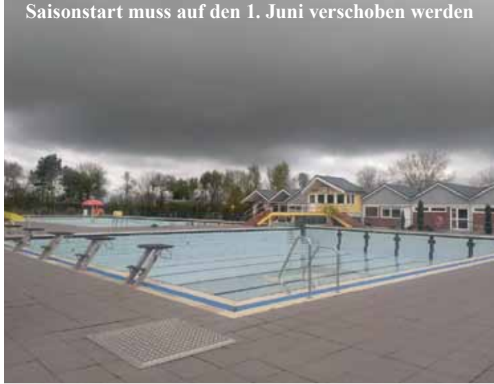
Saisonstart muss auf den 1. Juni verschoben werden

Eigentlich war alles gut: Der Sprungturm - das neue Wahrzeichen des Bützflether Freibades in Leuchtturm-Optik - ist kurz vor der Fertigstellung, der Trimaran wartet darauf, ins Wasser gelassen zu werden, die Bädergesellschaft plant die Beleuchtung, die Themen für die Wohlfühlabende stehen, die Außenanlage ist tiptop, die Innenräume ebenso. Einziges Sorgenkind war (und ist) der Putzdienst. Und dann die Hiobsbotschaft, beide Schwimmmeister kündigen sechs Wochen vor dem geplanten Saisonbeginn ohne Vorwarnung. Ein Supergau für Freibad und Vorstand,