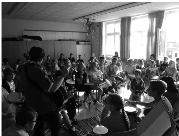
Schulstress raus und Musik rein - während ihrer Projektwoche reisten die Grundschüler musikalisch rund um die Welt