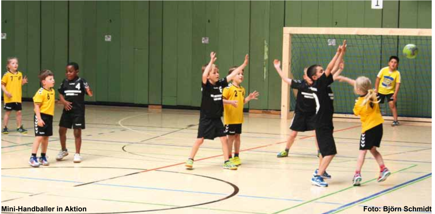
Mini-Handballer in Aktion