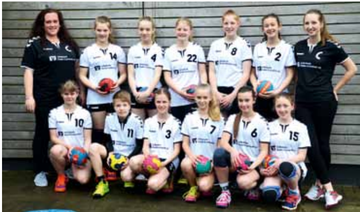
Die weibliche Jugend C hat eine überragende Landesliga-Qualifikation gespielt und sich die neuen Trikots, gesponsert von der Volksbank Stade/Cuxhaven redlich verdient

Fünf unserer BüDro-Jugendmannschaften haben an Qualifikationen zur Landes- bzw. Oberliga. Ganz sicher, verlustpunktfrei und mit einer überragenden