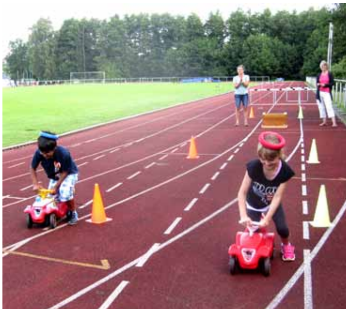
Ein Bobby-Car ist wohl etwas für jedes Alter - kommt nur drauf an, wie man sich damit fortbewegt.

tummelten sich auf dem Sportplatz in Ottenbeck. Vereine und Schulen präsentierten sich jeweils an ihrer eigenen Station. Alle Kinder hat so die Möglichkeit, den großen Sportparcours auszutesten.