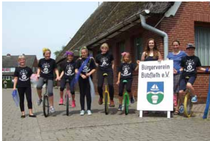
Die Einradgruppe der Grundschule hat schon setzte bei der Jubiläumsfeier sportliche Glanzlichter.

Die Schützenhalle füllte sich schon eine halbe Stunde vor Veranstaltungsbeginn rasch mit erwartungsfrohen Gästen. Der Dienst am Getränketresen war an diesem Tag wegen der hochsommerlichen Temperaturen kein leichter Job. Etliche Vereinsmitglieder hatten dafür gesorgt, dass das Torten- und Kuchenbuffet reichlich gefüllt war und so setzte auch gleich der Sturm auf das Kuchenbuffet ein. Das kollidierte ungewollt etwas mit dem ersten Pro-