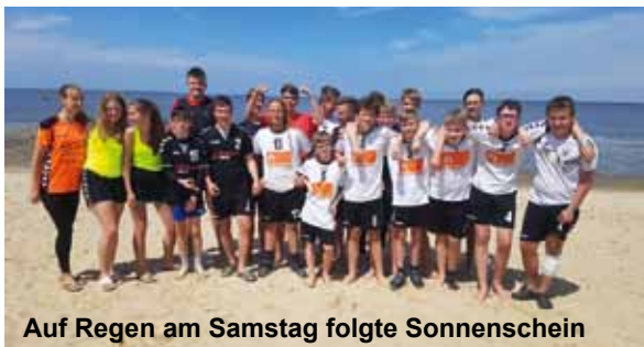
Auf Regen am Samstag folgte Sonnenschein

Die beiden nächsten Gegner waren uns körperlich überlegen, trotzdem gelangen uns viele gute Aktionen. Gerade beim dritten Spiel im Stadion am